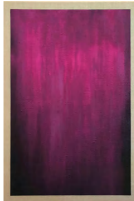
Rosa Resonanzraum 2024, H 150 x 100 cm, Bitumen, Pigment auf Jute

Der Maler und Musiker über sein Werk: „Meine abstrakten Arbeiten verlangen danach, erfahren anstatt begriffen zu werden. Der malerische Prozess zeichnet sich durch einen meist offenen, intuitiv reagierenden und suchenden Charakter aus. Ich versuche ein bildnerisches Pendant zu der sprachlosen Poesie klanglicher Phänomene zu entwickeln. Ob harmonisch, dissonant, rauschend oder rhythmisch – die Malereien und Grafiken postulieren durch Farbe, Form und Materialität eine Sinnhaftigkeit, die nicht sprachlich gedeutet aber, ähnlich der Musik, unmittelbar sinnlich erfahren werden kann. Diese Unmittelbarkeit,